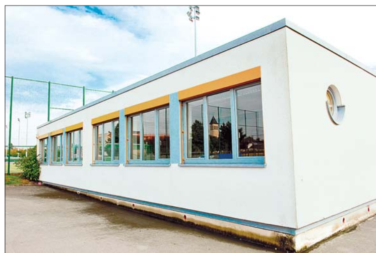
Les membres de syn 2 cat partagent leur nouveau QG avec l'asbl Treff-ADHS

Pour les membres de l'association, un hackerspace est «une fusion entre atelier, centre de recherche et de lieu de rencontre. Des personnes de tout âge et origine s'y rejoignent régulièrement pour travailler sur des projets communs, proposer et suivre des séminaires ou simplement échanger des idées. La mise à disposition d'une infrastructure de base, comme des ordinateurs, des fers à souder ou des composants élec-