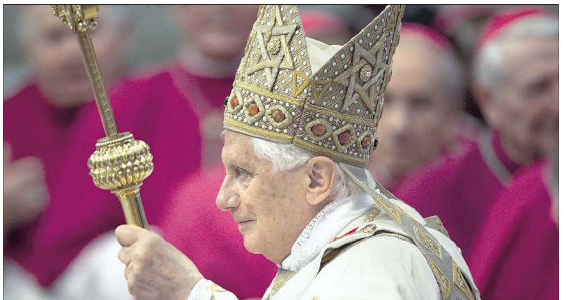
Aux yeux du Pape, Jeanne Jugan «est comme un phare pour guider nos sociétés»